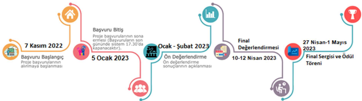
Şekil 2: Yarışma Takvimi