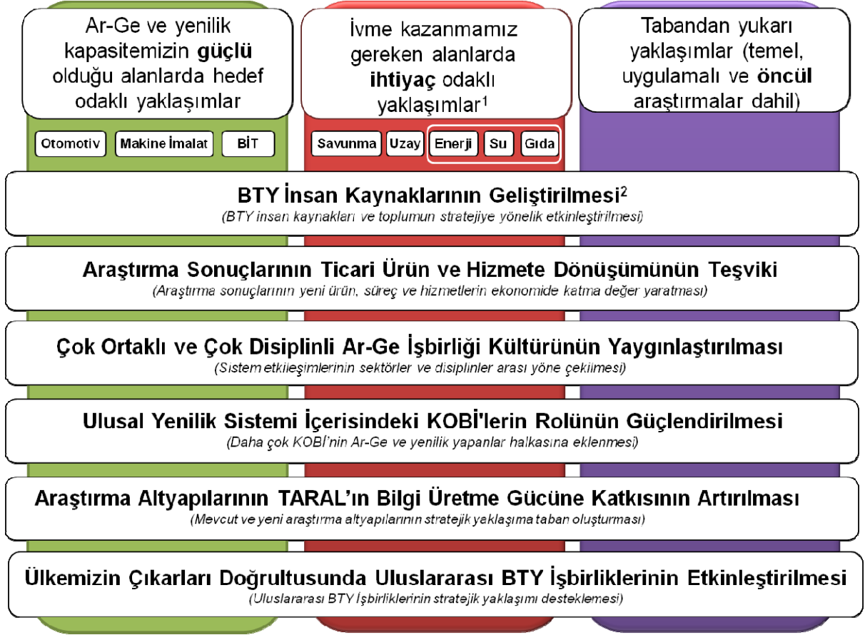
Şekil 1. Ulusal Bilim, Teknoloji ve Yenilik Stratejisi (UBTYS) 2011-2016'nın Stratejik Çerçevesi

Şekil 1'de verildiği üzere UBTYS 2011-2016 Stratejik Çerçevesi üç dikey eksen (yeşil, kırmızı ve mor eksenler) ve bunlara hizmet eden altı yatay eksenden oluşmaktadır. Dikey eksenler içerisindeki ilk iki eksen, ülkemizin Ar-Ge ve yenilik kapasitesi açısından güçlü olduğu alanlarda hedef odaklı yaklaşımlar ile ülkemizin jeopolitik konumunu ve ülke gereksinimleri itibarıyla Ar-Ge faaliyetlerinin ivme kazanması gereken alanlarda ihtiyaç-odaklı yaklaşımlardır. Bu iki dikey eksenin yanı sıra stratejik çerçevenin üçüncü dikey eksen, çeşitli alanlarda yaratıcılığın desteklenmesinin devam edilmesine yönelik "tabandan yukarı" yaklaşımlardır. UBTYS 2011-2016 stratejik çerçevesindeki dikey eksenlerine ilişkin tanımları şöyledir: