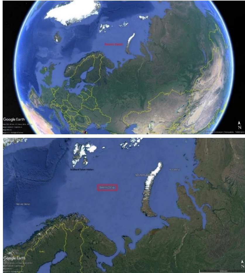
TASE-3 Seferi bölgesi (Barents Denizi)

18. TASE-3 seferi katılımcılarının ulusal ve uluslararası kurallara, mevzuatlara ve sefer sırasında uğranacak ülkelerin ilgili ulusal mevzuatına uygun şekilde hareket etmesi gerekmektedir. Sorularınız için kutup@tubitak.gov.tr adresine e-posta gönderebilirsiniz.