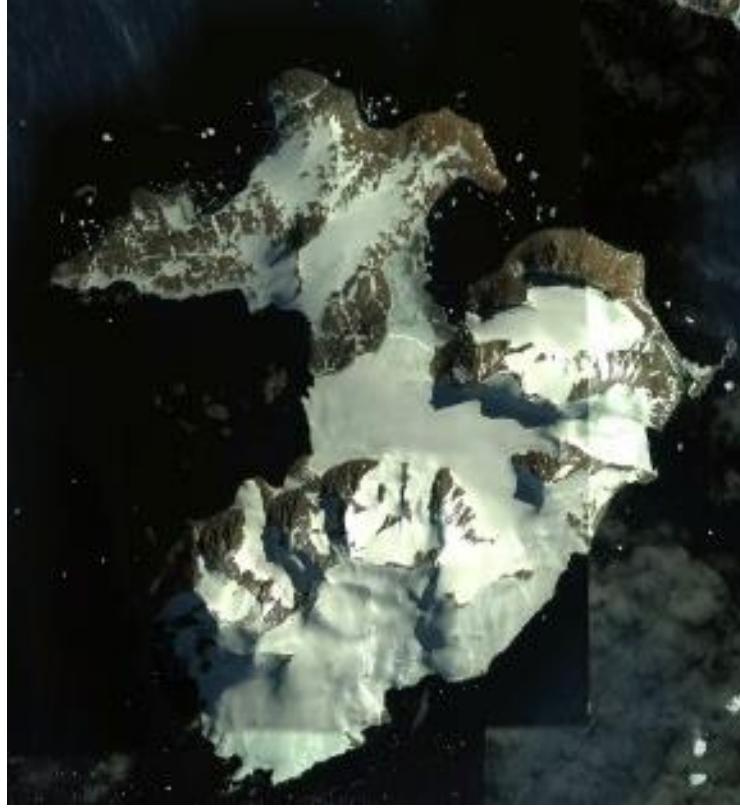
TAE-8 Seferi Horseshoe Adası

20. Proje yürütücüsü, desteklenmeye uygun bulunan projenin gerçekleşmesi için Antarktika kıtasında yapılacak çalışmaların Antarktika Antlaşması Çevre Koruma Protokolü'ne uygunluğunu taahhüt etmekle sorumludur. Projenin gerçekleştirilmesi sırasında oluşabilecek çevre etkisi için ilgili formlar T.C. Çevre, Şehircilik ve İklim Değişikliği Bakanlığı'na iletilmek üzere TÜBİTAK MAM KARE ile koordineli olarak hazırlanacaktır. Sorularınız için kutup@tubitak.gov.tr adresine e-posta gönderebilirsiniz.