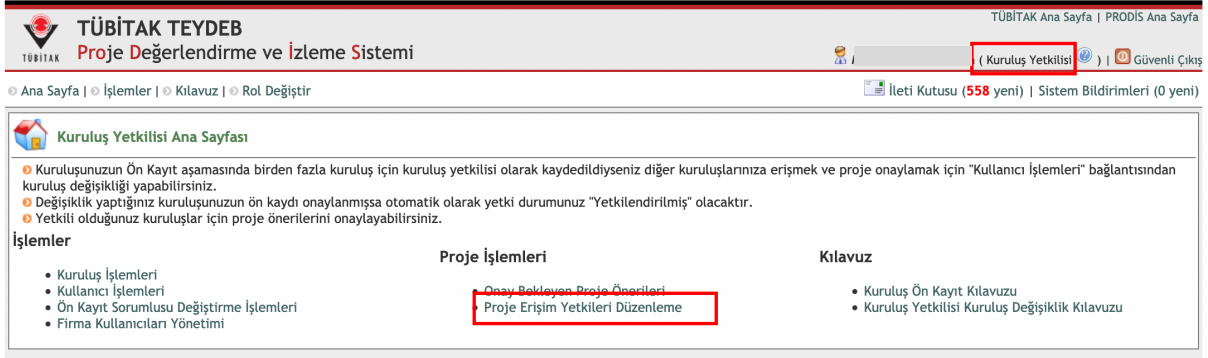
Şekil 1. Kuruluş Yetkilisi Proje Erişim Yetki Düzenleme Bağlantısı