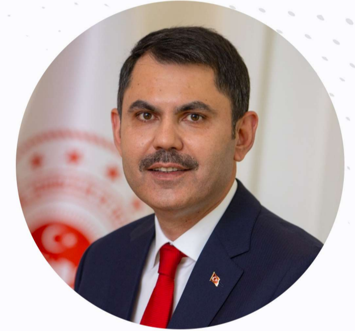
Murat Kurum Çevre, Şehircilik ve İklim Değişikliği Bakanı (Tensipleri Halinde)