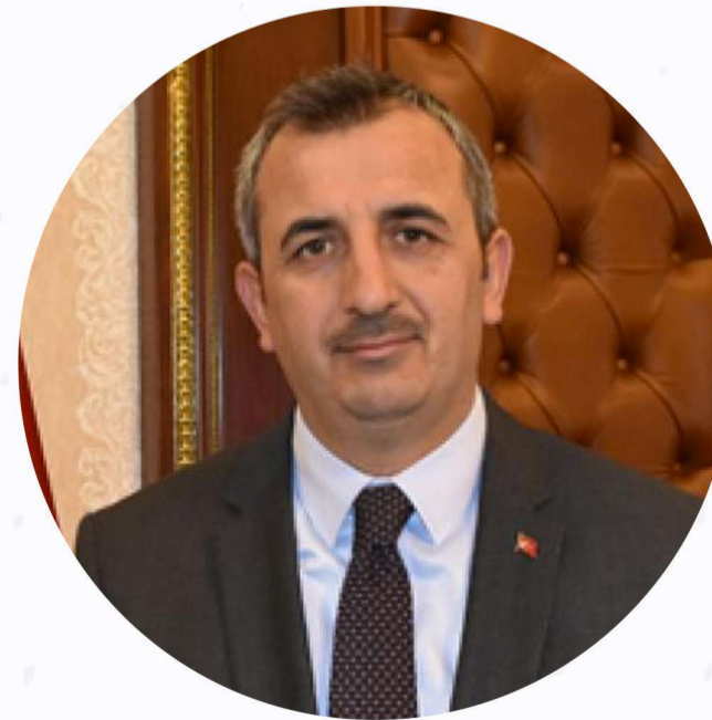
Yunus Sezer AFAD Başkanı