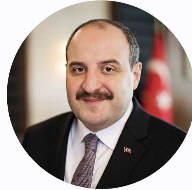
Mustafa Varank Sanayi ve Teknoloji Bakanı