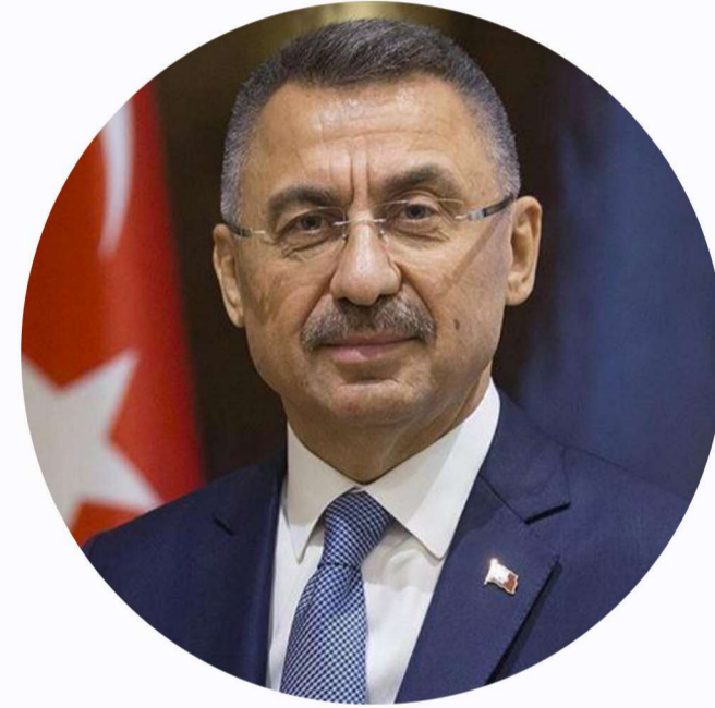
Fuat Oktay Cumhurbaşkanı Yardımcısı